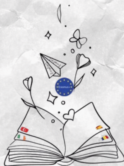
The Art of Creative Writing

This month at Escola Sant Josep we received the visit of teachers from Turkey, Romania, Spain and Ireland. They came to attend a meeting about an Erasmus project called THE ART OF CREATIVE WRITING. The main objective of this project is to work on storytelling through art and gamification. It was a pleasure to have them here!